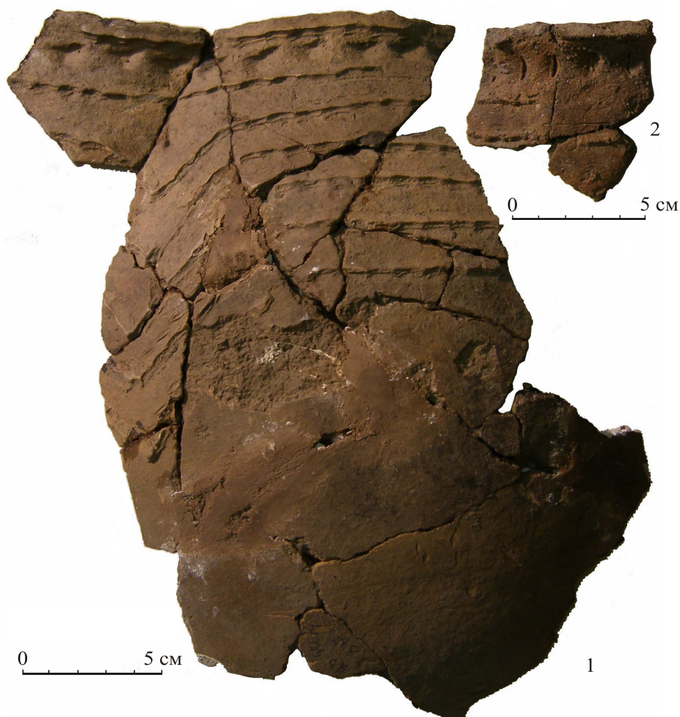
Рис. 1. Керамика с тонкими налепными жгутиковыми валиками из поселений Язаевка (1) и Стрелковский порог (2)

Сосуды лепились ручным способом из глины с примесью песка и дресвы. Часто формовочная масса подготовлена плохо (можно считать, небрежно), песок не просеивался, отчего нередко попадают мелкие окатанные камушки. Обжиг керамики