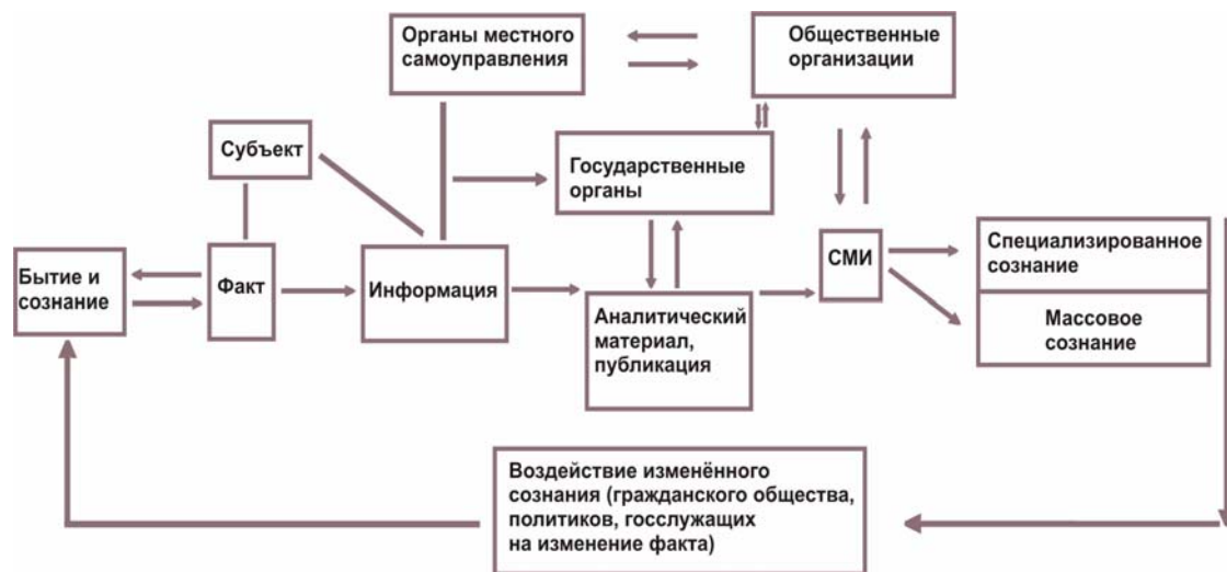
Рис. 1. Информационные процессы как средство государственного управления

Последовательность влияния на мнение граждан в результате инициации того или иного политического события отображена на рис. 1, предлагаемом В. Д. Поповым 24 .