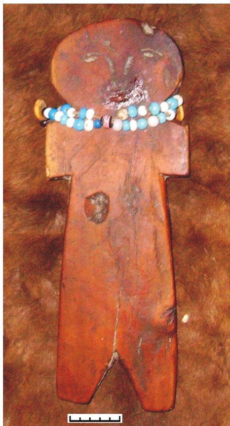
Рис. 5 (фото). Амулет-охранитель на подстилке из оленьей шкуры (пос. Эвенск Северо-Эвенского района Магаданской области, 2006 г.)

гласно которым стадо, жилище и огнива наследовались по мужской линии.