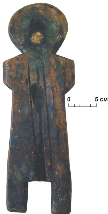
Рис. 2 (фото). Огневой прибор (инвентарный номер МОКМ КП-32230)

Прибор без принадлежностей (рис. 2) по форме аналогичен предыдущему. На его туловище от шеи до ног проходят три узких продольных желобка, в верхней части имеется большое углубление овальной формы. Наконец, четвертая огнивая доска с принадлежностями (рис. 3) отличается от первых трех размерами и формой. Она более короткая (длина 26 см против 32–39 см), книзу заужена, руки отсутствуют, «ножной» вырез