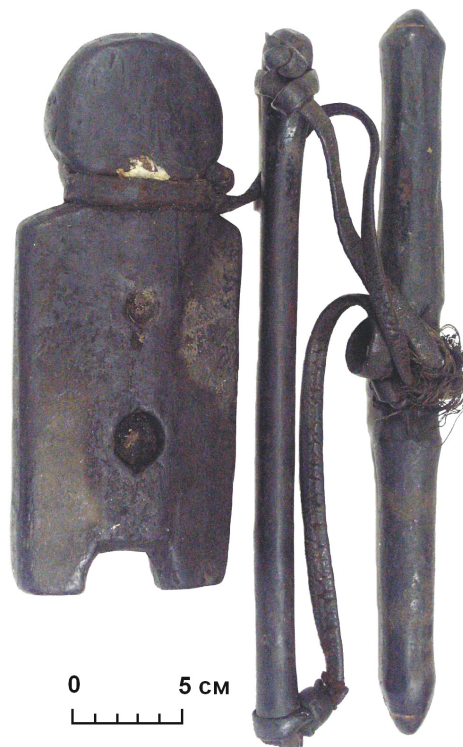
Рис. 3 (фото). Огневой прибор с лучком и сверлом (инвентарный номер МОКМ КП-32217/а-в)