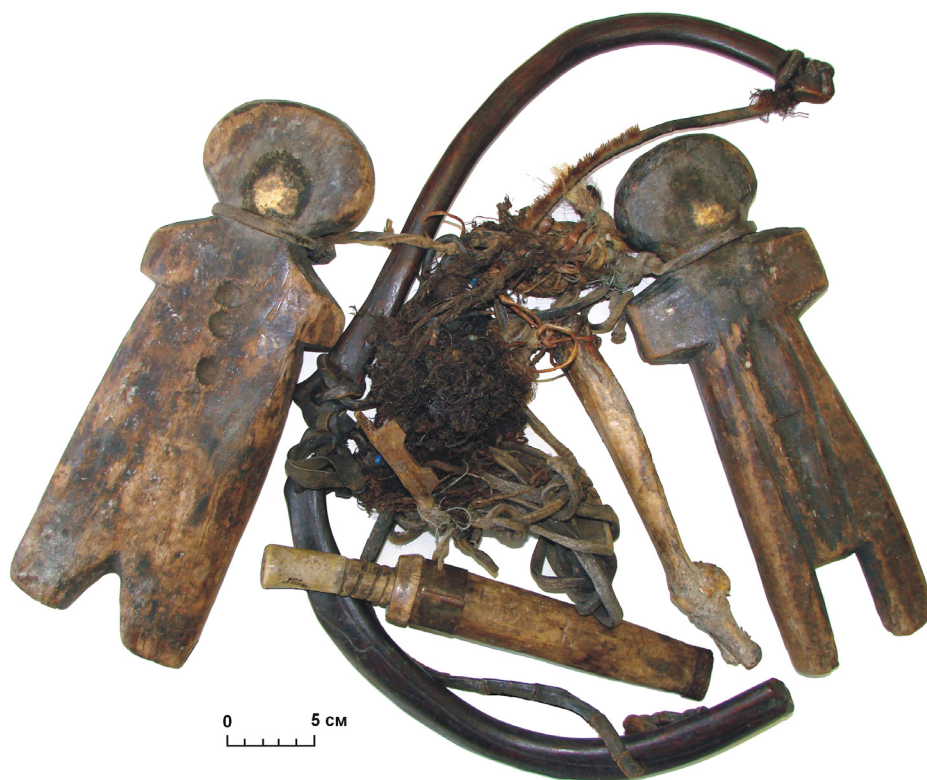
Рис. 1 (фото). Ритуальный комплекс с двумя огневыми приборами (инвентарный номер МОКМ КП-32229/а-ю)

Две огнивные доски составляют основу ритуального комплекса (рис. 1). Большая из них (на рис. 1 расположена слева) имеет вид плоского массивного бруска антропоморфного облика. Верхняя часть оформлена в виде овальной головы, шейная перемычка узкая. Плечики скошены, переходят в короткие тра-