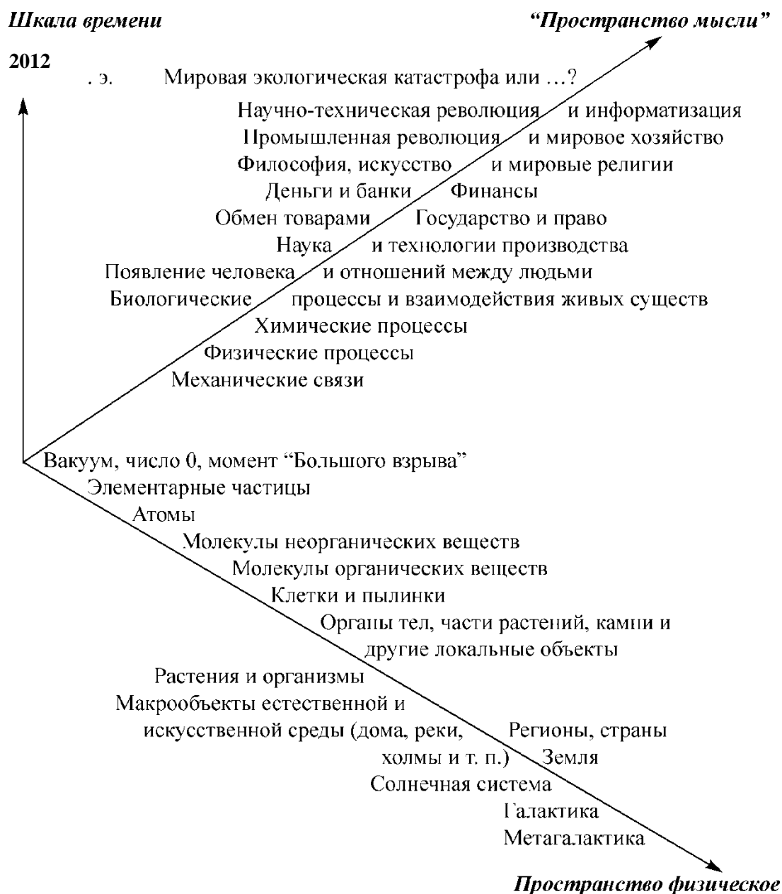
Рис. 0А2. Иллюстрация развития (развертывания) во времени объектов, субъектов и взаимосвязей физического и информационного пространств нашей Вселенной исходя из гипотезы «Большого взрыва»

Четвертый прием. Соединение графика, на котором по одной из осей откладывается время, и схемы взаимосвязи объектов, направлений исследований и т.п. Это может быть некоторое условное время, при помощи которого можно лучше представить взаимосвязь материальных, денежных и информационных потоков на предприятии с учетом различных управленческих решений, или это может быть реальное историческое время, например, для отображения истории развития бухгалтерского учета. Часто на временной оси для удобства построения откладываются отрезки, которые приблизительно соответствуют реальной продолжительности.