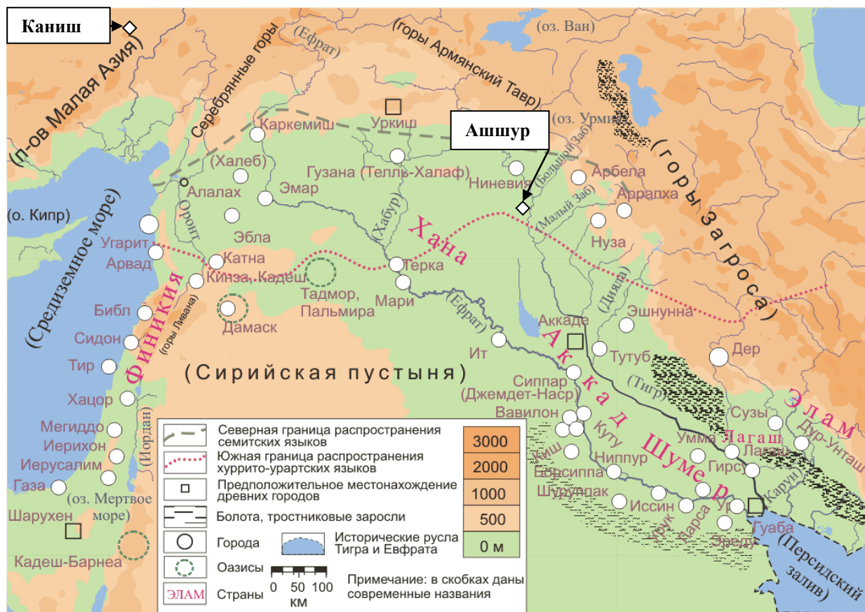
Рис.0А3. Карта Древней Месопотамии с выделением городов Ашшура и Каниша*

Примечание: Пометки автора на карте с URL: http://gumilevica.kulichki.net/maps/he101.html .