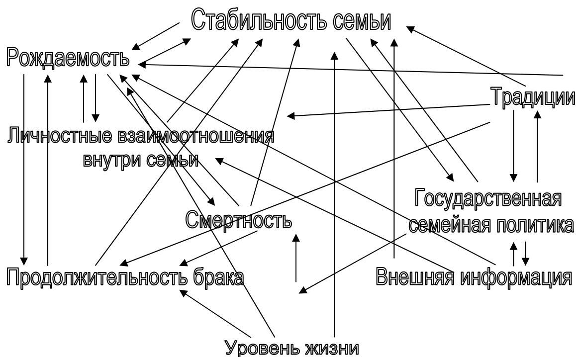
Рис. 1. Взаимодействие факторов, определяющих стабильность семьи

Зависимость стабильности семьи от уровня рождаемости, смертности, продолжительности брака, уровня жизни, традиции и других переменных мы можем проследить по Республике Хакасия. Если рассматривать территорию Хакасии в середине XX в., то заметен сильный рост рождаемости, как и в целом по России, приходящийся на послевоенный период и длящийся в среднем около 4 лет (рис. 2). В последующем уже в начале 1970-х гг. как в европейских странах, так и в Российском государстве наметилась новая тенденция в изменении демографического поведения – массовый переход к планированию числа детей в семье, что нашло свое отражение и на территории субъекта РФ – Республике Хакасия. Отмечается снижение показателей рождаемости в Хакасии в 70-е гг. и небольшое повышение в 80-е гг., что было вызвано изменением половозрастной структуры – вхождением в детородный возраст сравнительно многочисленной когорты молодежи. В 1990–2000-е гг.